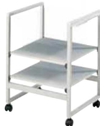
Table de projection avec deux plans de travail jusqu'à une hauteur de 72 cm. Base:46x41 cm. Avec quatre roulettes à galet, dont deux blocables.