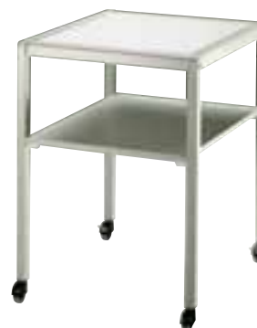
Table de projection robuste avec 4 roulettes, dont 2 blocables. Plateau de table démontable.